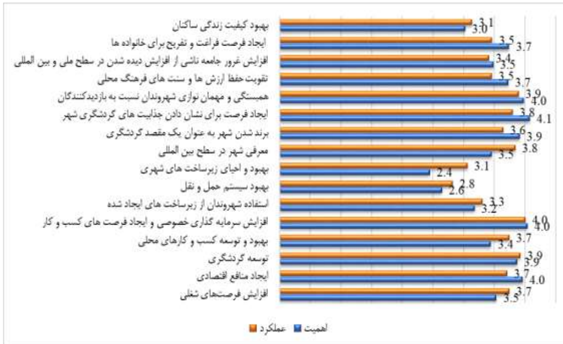
شکل ۲. میانگین اهمیت و عملکرد هر یک از ابعاد

ربع اول نشان‌دهنده عواملی است که اهمیت بالایی دارند اما عملکرد مقصد پایین است و بنابراین نیاز به بهبود دارند. عوامل ربع دوم دارای اهمیت و عملکرد بالا هستند و باید حفظ شوند. ربع سوم عواملی با اهمیت و عملکرد