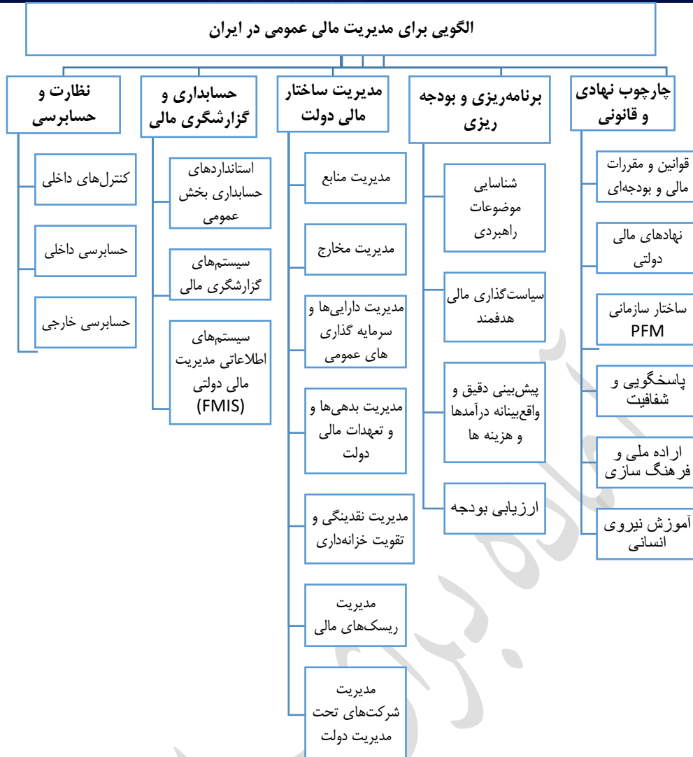
شکل ۲. الگوی برای مدیریت مالی عمومی در ایران