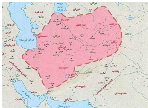
(نقشه پیشنهادی جدید برای مرزهای تصحیح شده حکومت طاهریان بر پایه نقشه موجود در کتاب جغرافیای مرز)

عصر عبدالله بن طاهر اختلاف نظری ندارند. شهرهای تابع حکومت طاهری در این دوران اوج در گزارش ابن خردادبه به صورت جزئی و دقیق شناسایی شده‌اند (ابن خردادبه، ۱۸۸۹: ۳۴-۳۷). در نقشه طاهریان در اطلس‌های ایرانی شهرهای بست، قندهار و مولتان در شمار شهرهای تابع طاهریان قلمداد شده است؛ در حالی که بر اساس گزارش منابع مکتوب کهن و استدلال‌های ارائه شده در این مقاله، به ویژه در بخش سرحدات شرق و جنوب شرقی، شهرهای پیش‌گفته را نمی‌توان متعلق به جغرافیای سیاسی طاهریان دانست. همچنین در گزارش ابن خردادبه نام جزیره هرموزی در میان شهرهای باج‌گزار حکومت طاهریان وجود ندارد و نمی‌توان نقشه‌های موجود که مرزهای طاهریان را تا این بندر امتداد داده‌اند مستند دانست. بر این اساس نقشه دیگری طراحی و پیشنهاد شده است که مرزهای شرقی و جنوب شرقی حکومت طاهریان در آن تصحیح و بازترسیم شده است. لازم به توضیح است که نقشه پیشنهادی، برگرفته از نقشه طاهریان موجود در کتاب جغرافیای مرزهاست که با اندکی اصلاحات در بخش جنوب شرقی آن، دوباره ترسیم شده است.