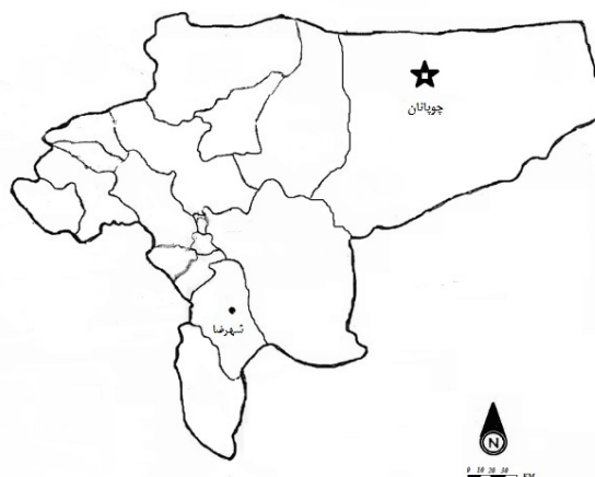
شکل ۱. نقاط نمونه‌برداری دوپای هاتسون (چوپانان) و فیروز (شهرضا) در محدوده استان اصفهان، ایران

و دندانی نمونه‌های دوپای جمع‌آوری شده از نقاط مختلف استان اصفهان وجود اختلاف را بین دوپای هاتسون و فیروز مسجل ندانسته و پیشنهاد زیرگونه‌های مجزا را داده‌اند. Ghaderi (2010) با مطالعه تعداد شش نمونه دوپای، روابط فیلوژنتیک گونه‌های جنس Allactaga را با استفاده از ژن سیتوکروم اکسیداز ساب یونیت I تحلیل نموده و نتایج نشان‌دهنده عدم وجود تفاوت ملکولی بین دوپای فیروز و دوپای هاتسون بوده است. با توجه به وجود این یافته‌های متناقض، لازم است که بررسی‌های ژنتیکی دقیق‌تر با استفاده از نشانگرهای میتوکندریایی مانند ریزماهواره و آلوزایم انجام گردد (Rahimpazhuh et al. , 2012). DNA میتوکندری در تشخیص گونه‌ها و ترسیم رابطه فیلوژنتیکی دارای مزایایی از جمله تعداد زیاد نسخه به ازای هر سلول، اندازه کوچک‌تر آن از DNA ژنومی، وراثت‌پذیری مادری، هاپلوئید بودن، عدم وجود نوترکیبی در آنها و وجود نواحی حفاظت‌شده می‌باشد (Hosseini et al. , 2015). ژن‌های میتوکندریایی ابزاری مهم در مطالعات مختلف در زمینه‌های تکامل جانوران، فیلوجغرافیایی و فیلوژنتیک می‌باشد (Rokas et al. , 2003). به دلیل این‌که تمام DNA میتوکندریایی به صورت یک واحد خاص یا هاپلوتاایپ به ارث می‌رسد خویشاوندی‌های بین DNA میتوکندری افراد متفاوت را می‌تواند به صورت یک درخت ژنی نشان داد. الگوهای این درخت‌های ژنی