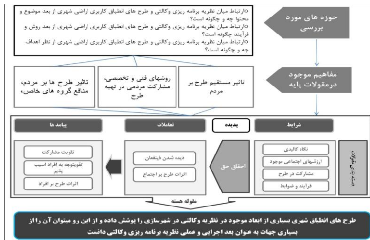
شکل ۲: مدل زمینه ارتباط میان نظریه برنامه ریزی و کالتی و طرح های انطباق کاربری اراضی در مقیاس شهری