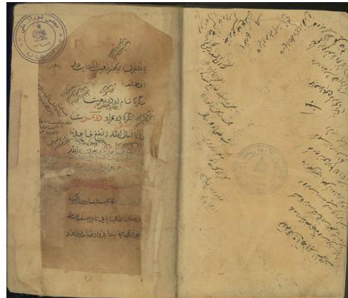
شکل ۱. صفحه نخستین از نسخه خطی شماره ۸۸۲۰ کتابخانه مجلس

تَنَافُر، غِرَابَت، مَخَالَفَت قِیَاس، کِرَاهَت در سَمْع، ضَعْف تَأْلِيف، تَعْقِيد، کَثْرَت تَكَرَّر، تَتَابِع اِضَافَات، فِک اِضَافَه، حَشْو و تَطْوِيل، اِفْرَاط، اِنْقِطَاع، اِخْلَال،