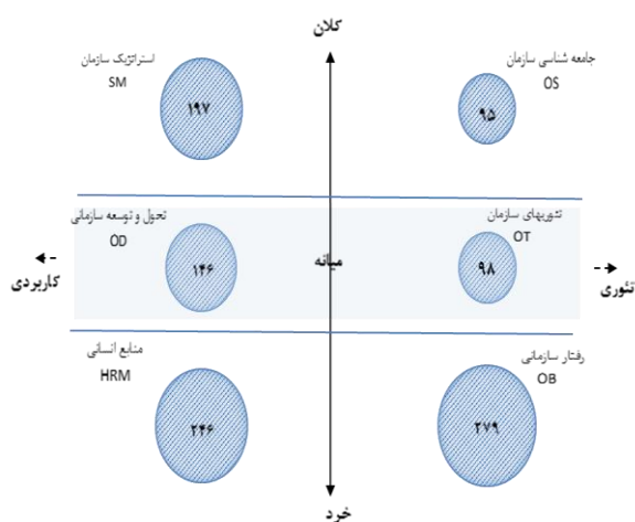
نمودار ۲. شمای کلی توجه پژوهشگران به حوزه‌های سازمان در بخش دولتی

مقایسه پژوهش‌ها در سطح کلان و میانه سازمان متوجه می‌شویم که پژوهش‌ها در سطح کاربردی از پژوهش‌ها در سطح تئوریک سازمان از استقبال بیشتری برخوردار بوده‌اند.