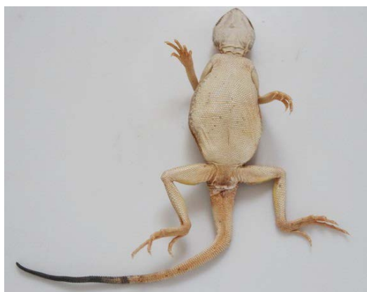
شکل ۴. آگامای سر وزغی دم سیاه ماده حامل تخم از سطح شکمی