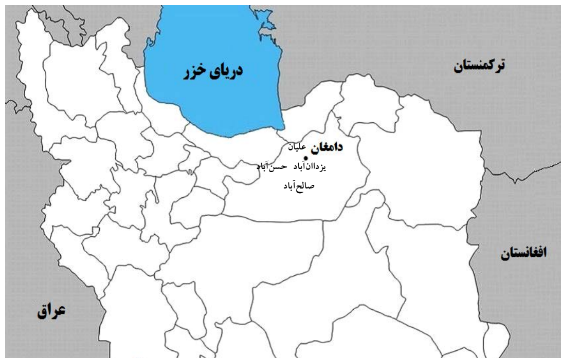
شکل ۱. نقشه منطقه مورد مطالعه با مقیاس ۱:۲۵۰۰۰۰۰