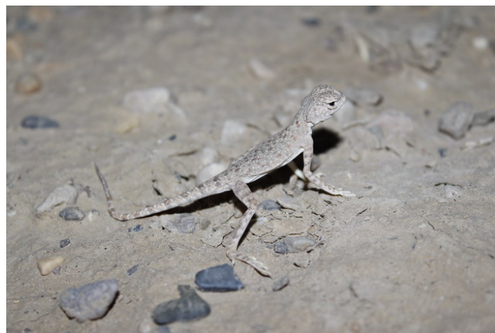
شکل ۲. آگامای سر وزغی دم سیاه نر در روستای حسن‌آباد دامغان

بدن، طول بدن، طول سر، عرض سر، طول دم، فلس‌های لب بالا و پایین در راست و چپ و فلس‌های دور میانه بدن نیستند (جدول ۲، نمودارهای ۱ و ۲). البته تعداد فلس‌های لب پایین راست و چپ در سطح معنی‌داری p < 0/05 تفاوت معنی‌داری را نشان می‌دهند. همچنین عرض سر نیز در لبه مرز معنی‌داری است ( p = 0/06 ) آن شش صدم است. تفاوت خاصی در رنگ بدن یا فلس‌بندی نر و ماده مشاهده نشد.