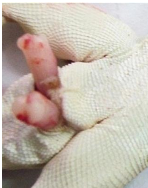
شکل ۵. همی‌پنیس در آگامای سر وزغی دم سیاه نر از سطح شکمی