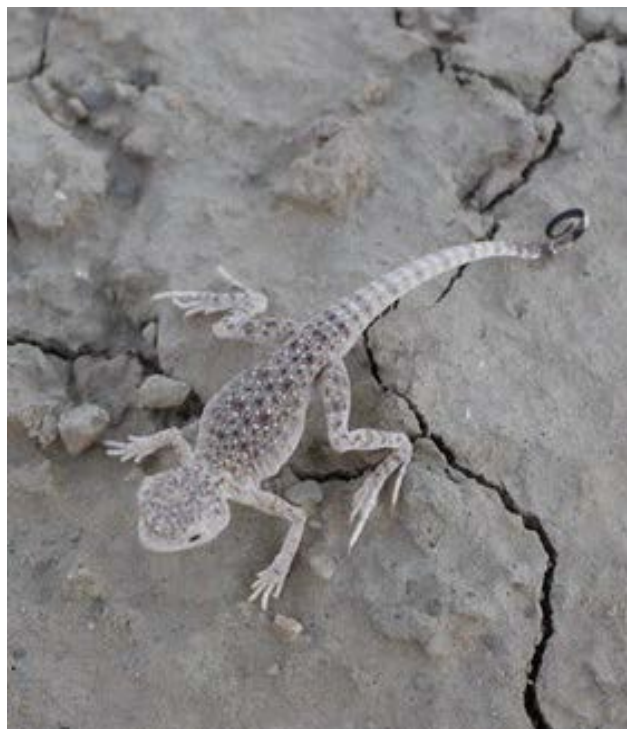
شکل ۳. آگامای سر وزغی دم سیاه ماده حامل تخم از سطح پشتی در روستای حسن‌آباد دامغان