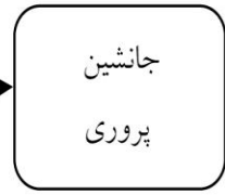
شکل ۱. الگوی کدگذاری و پارادایمی براساس یافته‌های کیفی پژوهش

آینده‌نگری، جامعیت، عدالت و انعطاف‌پذیری بیشتر ۸۵/، بوده، این نشان‌دهنده این مطلب است که تحلیل عاملی برای این داده‌ها بسیار مناسب است. بنابراین، براساس تحلیل عاملی اکتشافی از مبانی نظری و بخش کیفی پژوهش، در ابعاد شایستگی ۱۰ مؤلفه، آینده‌نگری ۳ مؤلفه، جامعیت ۶ مؤلفه، عدالت ۳ مؤلفه و انعطاف‌پذیری ۲ مؤلفه، مبنای تحلیل آماری قرار گرفتند. در جدول (۳) نتایج تحلیل عاملی اکتشافی نشان داده شده است.