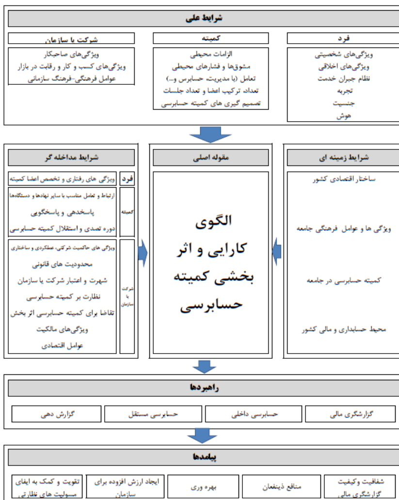
شکل ۱. الگوی ارتقاء کارایی و اثربخشی کمیته حسابرسی (علی حسینی، بشکوه و کردستانی، ۱۴۰۱)

تداخل مسئولیت‌های متعدد اعضا (براندز و همکاران ۱ ، ۲۰۱۶؛ خاندکار و همکاران ۲ ، ۲۰۱۶)، دوره تصدی (دالی‌وال و همکاران ۳ ، ۲۰۱۰؛ چان و همکاران ۴ ، ۲۰۱۳) و جنسیت (آدامز و فریرا ۵ ، ۲۰۰۹؛ گل و همکاران ۶ ، ۲۰۱۱)، و در نهایت اندازه و میزان فعالیت کمیته (الوود و گارسیا - لاکاله ۷ ، ۲۰۱۶؛ جبرایل و همکاران ۸ ، ۲۰۱۸) را در بر می‌گیرد. افزون بر این رابطه بین ویژگی‌های قابل‌اندازه‌گیری کمیته حسابرسی و اثربخشی حاکمیت شرکتی از طریق سه نتیجه اساسی فرآیند گزارشگری شامل کیفیت حسابرسی داخلی، کیفیت حسابرسی مستقل، و کیفیت اطلاعات مالی، مورد توجه قرار گرفته است (کارسلو و همکاران، ۲۰۱۱؛ غفران و آسالیوان ۹ ، ۲۰۱۳). به‌طور کلی، با بررسی ادبیات و پیشینه موضوع کارایی و اثربخشی کمیته حسابرسی می‌توان نتیجه گرفت که در زمینه