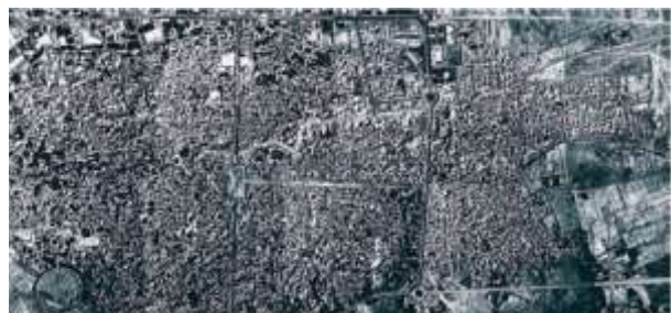
شکل ۶. عکس هوایی کاشان سال ۱۳۳۵ شمسی - ۱۹۵۶ میلادی (نگلیا، ۲۰۱۸: ۱۰۱)

اشکال (۶ و ۷ و ۸) نشان می‌دهند با احداث خیابان‌های سراسری در طول دهه‌های ۳۰، ۴۰ و ۵۰ قرن چهاردهم شمسی حصار سلجوقی محو شد و چهره شهر بکلی دگرگون گردید.