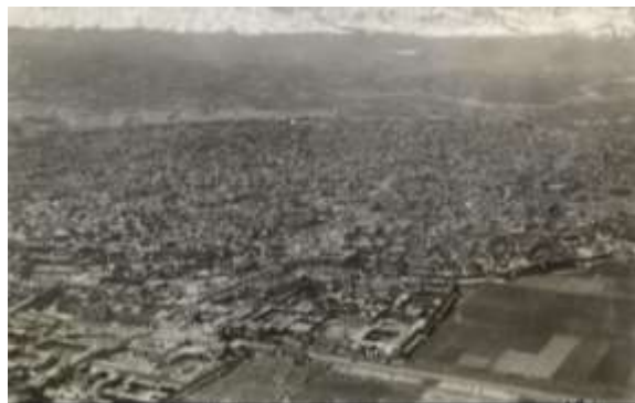
شکل ۵. عکس هوایی شهر کاشان در سال ۱۳۰۴/۱۹۲۵ میلادی (اثر والتر میتل هولتسر)

قرن چهاردهم شمسی، قرن تغییر و تحول در نظام شهری سنتی ایران است. عکس‌های به‌جای مانده از آن دوران گواهی می‌دهند که از اوایل قرن چهاردهم تا حدود سال ۱۳۴۰ تغییرات بطئی و تدریجی است و زمینه‌ساز دگرگونی‌های عظیم سال‌های باقی‌مانده قرن است. شکل ۵، اثر هولتسر مربوط به دوره‌ای است که شهر هنوز زخم‌های مدرنیسم را به تن رنجور و قدیمی خود متحمل نشده است. حصار سلجوقی در محدوده پایین عکس و وجه تمایز بافت شهر و محیط بیرون از بارو در محدوده بالای عکس بازگوکننده وجود حصار سلجوقی در سال ۱۳۰۴ شمسی است.