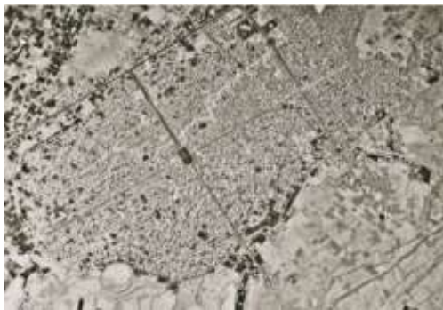
شکل ۷. عکس هوایی کاشان سال ۱۳۴۵ شمسی/۱۹۶۶ میلادی