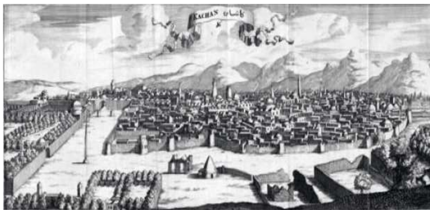
شکل ۴. نمای شهر کاشان در دوره صفویه قرن هفدهم میلادی اثر ژان شاردن (ویکی پدیا، ۱۴۰۱)

می‌گوید: "شهر در دیوارهای بلند خوش‌ساخت محصور است (همان: ۷۸). فدت آفاناس یویچ کاتف (۱۶۲۳-۱۶۲۴ م.) نوشته است: دور شهر را دیوار گلی در برگرفته است (همان: ۹۷). ژان شاردن ۵ (۱۷ م.) که در شکل ۴ نمای شهر کاشان را از بیرون شهر نشان می‌دهد نوشته: "برج و باروی شهر دارای دیوارهای مضاعفی است و شهر پنج دروازه دارد (همان: ۱۰۸). برج و باروی شهر به‌عنوان مرز شهر، فشرده‌گی بافت، تراکم بالا از جمله ویژگی‌های کاشان در قرن هفدهم میلادی است که شاردن به تصویر کشیده است.