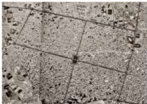
شکل ۸. عکس هوایی کاشان سال ۱۳۶۱ شمسی/۱۹۸۲ میلادی (نگلیا، ۲۰۱۸: ۱۰۳-۱۰۲)

علی‌اصغر مهاجر در سفرش به کاشان در سال ۱۳۴۰ از بالای مناره (زیارت حبیب ابن موسی) در بافت قدیم، شهر را این‌گونه توصیف می‌کند: "کاشان چتر ناهمواری است از کاه‌گل که اجداد باهمت کاشی‌ها آن را از خاک‌های حاشیه کویر ساخته‌اند و امروز اخلاف آن‌ها از گزند آفتاب به سایه آن پناه می‌برند. سقف‌های گنبدی و مخروطی و مسطح خانه‌ها، مغازه‌ها، یخچال‌ها و سراها تا آنجا که زور کاه‌گل می‌رسد بالاآمده‌اند و بادگیرهای خود را در معرض تندبادهای کویر قرار داده‌اند" (ساطع، ۱۳۸۹: ۴۷۷). فیلیپ بیسون (۲۰۰۸) آرشیتکت، نویسنده و عکاس فرانسوی در سفرش به کاشان در سال ۱۳۸۷ پس از توصیف جذابیت بازار و عناصری مانند کاروانسرای امین‌الدله و مدرسه سلطانیه به توصیف بادگیرها و بام‌های مخروطی پرداخته است و به متروکه بودن یخچال شهر و عدم دسترسی مناسب به امکانات شهری اشاره کرده است (همان: ۵۱۱-۵۱۴). به‌طور خلاصه ویژگی‌های شهر کاشان در قرن چهاردهم در جدول (۵) و در چهار بعد گردآوری شده است.