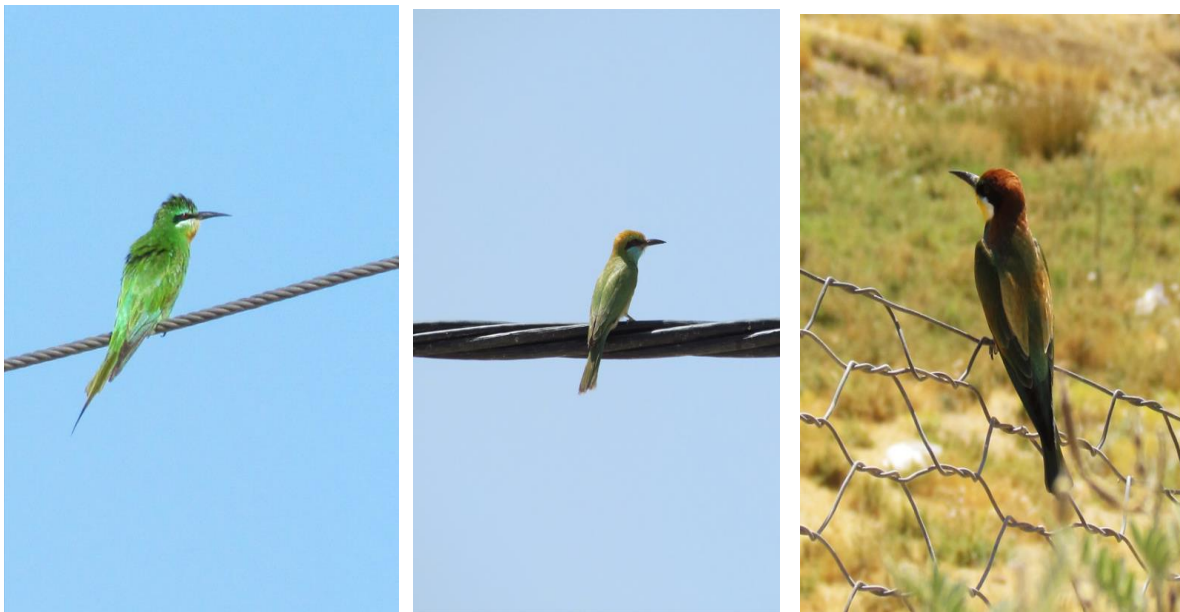
شکل ۱. تصویر سه گونه زنبورخوار مشاهده‌شده در استان فارس. شکل سمت راست: زنبورخوار معمولی یا اروپایی، سپیدان، شهریورماه ۱۳۹۶، شکل وسط: زنبورخوار سبز، خنج، فروردین‌ماه ۱۳۹۷ و شکل سمت چپ: زنبورخوار گلوخرمایی، جهرم، مهرماه ۱۳۹۶

عملیات میدانی در نقاط مختلف استان فارس به‌منظور بررسی پراکنش جنس زنبورخوار ( Merops ) از بهار سال ۱۳۹۶ تا مهر سال ۱۳۹۷ به مدت ۲۹ روز انجام شد. با توجه به اینکه زنبورخوار معمولی و گلوخرمایی مهاجر تابستان‌گذران هستند و زنبورخوار سبز گونه‌ای مقیم می‌باشد و در نیمه اول سال هر سه گونه در استان حضور دارند حدود ۸۰ درصد عملیات میدانی در فصل بهار و تابستان انجام شد. عملیات میدانی در تمام طول روز ولی اغلب در اوایل صبح و هنگام غروب که پرندگان فعال‌تر هستند انجام شد. عملیات میدانی به‌صورت گشت با ماشین در امتداد جاده‌های اصلی و جاده‌های خاکی و نیز پیاده‌روی در زیستگاه‌های مختلف و مشاهده (با استفاده از دوربین چشمی ۱۰×۵۰ و نگاردر) و عکس‌برداری از نمونه‌ها (Canon SX30) بود. گونه‌های مورد مطالعه بر طبق منابع (Mansoori, 2013) و مشاهدات میدانی در بسیاری موارد بر روی سیم‌های برق مشاهده می‌شوند. تمام نقاط پراکنشی به‌دست‌آمده براساس مشاهدات مستقیم می‌باشد. برای هر نمونه مشاهده‌شده، نام مکان، مختصات جغرافیایی شامل طول و عرض جغرافیایی و ارتفاع (با به‌کارگیری دستگاه GPS)، تاریخ و نام شناسایی کننده ثبت شد. سپس اطلاعات به بانک داده وارد، نقشه پراکنش گونه‌ها در استان در محیط نرم‌افزار ArcGIS 10.3 تهیه و مرزهای پراکنش گونه‌ها مشخص شد. برای تعیین این‌که