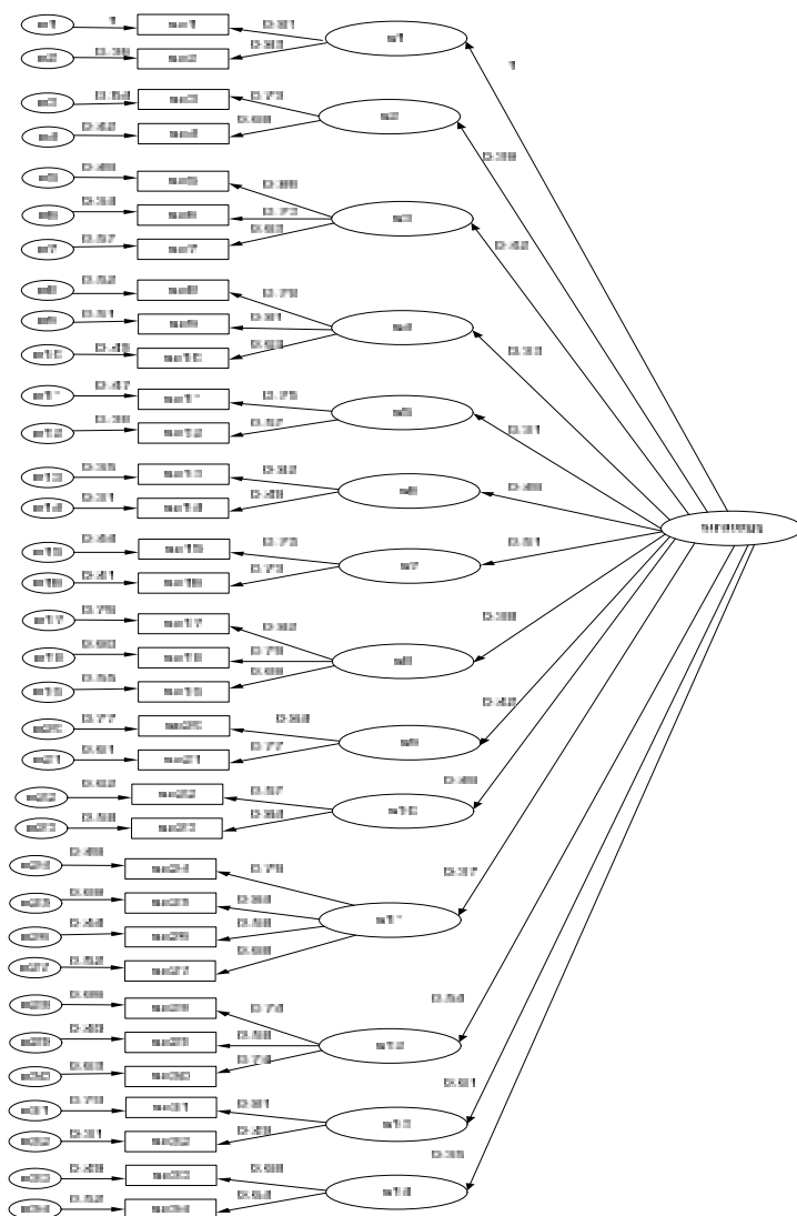
شکل ۱. نتایج تحلیل عاملی تأییدی مربوط به اهداف راهبردی فدراسیون ژیمناستیک