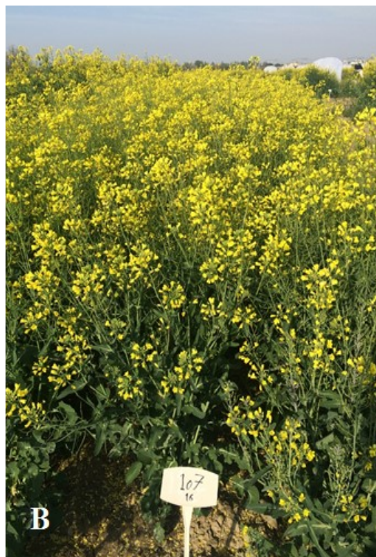
شکل ۱. ترکیب‌پذیری عمومی با اعمال تاپ کراس. (A) انجام تلاقی تاپ کراس لاین‌های دابل‌هپلوئید کلزا با والد هایولا ۴۲۰ (B). گیاهان حاصل از کشت بذور F1 به دست آمده از تاپ کراس لاین‌های دابل‌هپلوئید × هایولا ۴۲۰ در مزرعه

زمان مناسب استفاده از هر ۳ هورمون بهبود یابد (داده‌ها نشان داده نشده‌اند). بطور کلی جنین‌زایی میکروسپور قویاً تحت تاثیر ترکیبات محرک رشد قرار می‌گیرد (Ahmadi et al., 2012).