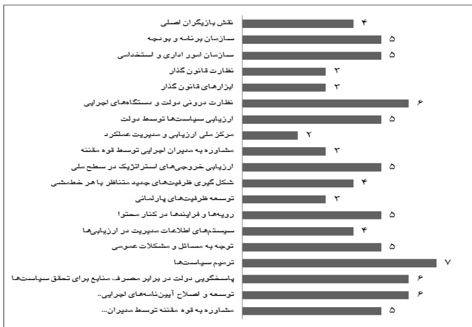
نمودار ۱. فراوانی رویکردها نسبت به مدیریت عملکرد در سطح دولت