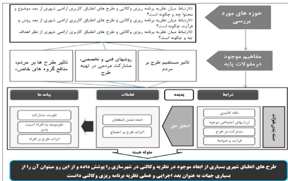
شکل ۲. مدل زمینه ارتباط میان نظریه برنامه‌ریزی و کالتی و طرح‌های انطباق کاربری اراضی در مقیاس شهری