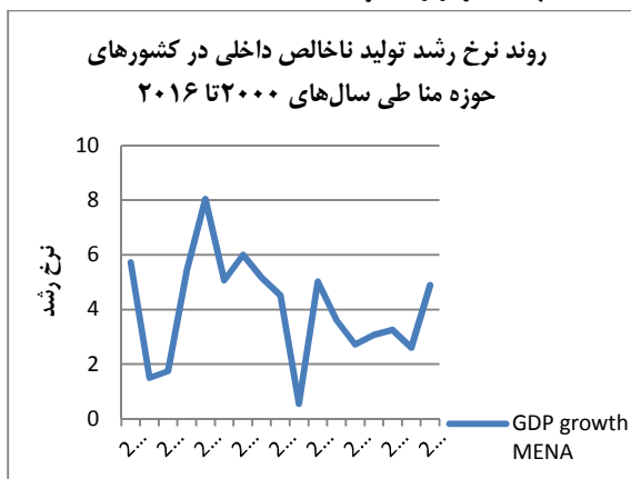
نمودار ۲. بی‌ثباتی در روند نرخ رشد تولید ناخالص داخلی کشورهای حوزه منا

در شکل (۲) بی‌ثباتی نرخ رشد GDP در کشورهای حوزه منا مشاهده می‌شود. علت بی‌ثباتی نوسانات قیمت نفت و بحران مالی به وجود آمده در سال ۲۰۰۸ است. بیشتر کشورهای حوزه منا وابسته به درآمدهای نفتی هستند و با افزایش قیمت نفت در سال ۲۰۰۲ نرخ رشد تولید ناخالص ملی افزایش می‌یابد و از سال ۲۰۰۸ با به وجود آمدن بحران مالی رشد تولید ناخالص ملی کاهش می‌یابد. رشد درآمد سرانه در این کشورها کمتر از رشد تولید ناخالص ملی است زیرا رشد جمعیت آنها بیشتر از رشد تولید است.