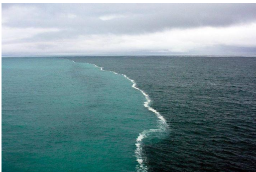
شکل ۱. آنجا که دو اقیانوس به هم می‌رسند

بشر همواره بر دو اقیانوس «واقعیت» و «خیال» شناور است. هر چند که اقیانوس‌ها را مرزی ظاهری نیست، ولیکن در پاره‌ای اوقات و در برخی مکان‌ها، برخورد دو اقیانوس تلاقی مشهودی را نمایان می‌سازد. استعاره و قابلیت استعارگی، به نظر پژوهشگران، همان فصلِ تلاقیِ دو اقیانوس واقعیت و خیال است. به دیگر سخن، استعارگی یک ویژگی ذهنی است که از امکان جذب و دفع پدیده‌های جهان نسبت به یکدیگر حاصل می-