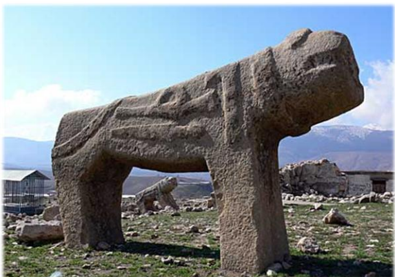
شکل ۶. سنگ قبرهایی به شکل شیرهای سنگی در لرستان

نگارندگان، ورای پیچیدگی‌های استعاره و اندیشیدن استعاری، ملهم از بازی «کلاغ‌پر»، به فرمولی ساده جهت تبیین وجود «شرایط استعاری» رسیده‌اند. پژوهشگر مسئول این مقاله در کنفرانس بوطیقای شناختی و بلاغت ۸ در شهر ووج لهستان به سال ۲۰۱۰ در قالب مقاله‌ای شفاهی تحت عنوان «استعاره‌های شنیداری-دیداری-کلامی در تبلیغات» ۹ نیز این فرمول را مطرح نموده است.