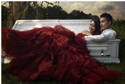
شکل ۲. تلفیق دو پنداره «ازدواج» و «مرگ» توسط زوج سنگاپوری

شود و از این رو امکان‌پذیری بی‌پایان دارد.