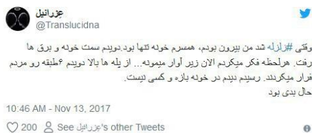
شکل ۲. داستان ۱: وقتی زلزله آمد

روایت‌های منفرد است که نشان می‌دهد این روایت‌ها به خودی خود معنادارند و اغلب ساختار خطی دارند.