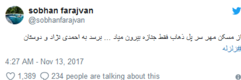
شکل ۷. روایت اثر مسکن مهر

در گام نهایی، ۱۰ خوشه اصلی که توسط DiscoverText در توئیتهای شناسایی شده‌است در جدول ۱۰ ارائه می‌شود تا مشخص شود هر خوشه به کدام روایت تعلق دارد.