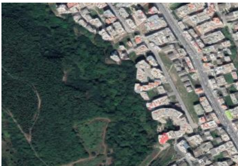
شکل ۲ موقعیت استقرار مجتمع های مسکونی پردیسان و شاه بلوط در شهر گرگان

است (مقدار آماره این آزمون باید بین ۱٫۵ الی ۲٫۵ قرار داشته باشد) مقدار این آماره در پژوهش حاضر برابر ۲٫۰۲ است که نشان دهنده تایید استقلال مشاهدات است یعنی خطاها از یکدیگر مستقل بوده و می‌توان از مدل رگرسیونی جهت آزمون فرضیه‌ها استفاده کرد. همچنین با توجه به مقدار R Square = 0.864 است که این مقدار نشان دهنده تغییرات متغیر وابسته تحت تأثیر متغیرهای مستقل و به عبارتی ۸۶ درصد از تغییرات احساس تعلق به مکان تحت تأثیر متغیرهای مستقل عوامل کالبدی است. با توجه به آزمون عملی واریانس ANOVA (جدول ۳)، برای تایید ضریب رگرسیونی از آزمون فیشر استفاده شد که نتایج آزمون نشان داد مشاهده شده در سطح خطای ۵ درصد معنادار است ( \text{sig}=0.000 < 0.005 ). بنابراین، کل مدل رگرسیون معنی دار است.