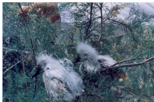
شکل ۳. جوجه‌های اگرت کوچک E. garzetta در مرحله Post-nestling - دوره‌ای که کرک‌های بدن از بین رفته و پرهای جدید شروع به رشد نموده و جوجه قادر به پرواز نیست ولی می‌تواند از آشیانه حرکت نموده و در محدوده‌های اطراف آشیانه جابه‌جا شود - جوجه‌های ۱۵-۲۵ روزه

بیشترین تلفات در مرحله قبل از تفریح به میزان ۲۵٪ ( n=25 )، در مرحله Nestling ۱۰٪ ( n=10 ) و در مرحله Post-Nestling ۳٪ ( n=3 ) محاسبه گردید (نمودار ۱). بر اساس نتایج آزمون فریدمن، اختلاف معنی‌داری در میزان تلفات در مرحله قبل از تفریح، Nestling و Post-Nestling وجود داشت (هریک p=0/05 ). در اگرت کوچک E. garzetta و در ارتباط با دستجات مختلف تخم، بیشترین تلفات در مرحله قبل از تفریح تخم، Nestling و Post-nestling به ترتیب ۱۲ درصد در دستجات ۴ تخمی، ۷ درصد و ۲ درصد در دستجات ۳ تخمی بوده است. با توجه به موقعیت جغرافیایی جزیره بیشترین تلفات به دلیل عوامل طبیعی رخ داده است (جدول ۳).