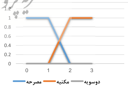
نمودار ۲. نمودار استعاره‌های دوسویه

در نمودار بعد که بر اساس معادله‌ی منطق فازی ترسیم شده است، می‌توان شکل و شیوه‌ی استعاره‌های دوسویه را مشاهده کرد: