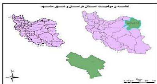
نقشه ۱. موقعیت استان خراسان و شهر مشهد

مشهد، کلان‌شهری در شمال شرقی ایران و مرکز استان خراسان رضوی است که براساس سرشماری عمومی نفوس و مسکن سال ۱۳۹۵، جمعیتی بالغ بر ۳,۰۱۲,۰۹۰ نفر دارد (مرکز آمار ایران). با بررسی دوره ۵۰ ساله شهر مشهد، این شهر سالانه به طور میانگین حدود ۱۱۵ هکتار مازاد بر نیاز جمعیت به مساحت شهر افزوده شده است. تراکم ناخالص شهری طی دوره ۸۵-۱۳۷۵ افزایش یافته به طوری که از ۸۲ نفر در هکتار در سال ۱۳۷۵ به ۹۷ نفر در هکتار در سال ۱۳۸۵ و به ۹۶ نفر در هکتار در سال ۱۳۹۰ رسیده است (سلیمانی مقدم، ۱۳۹۳: ۱۳۰). در مجموع می‌توان گفت که شهر مشهد از الگوی رشد پراکنده تبعیت کرده است که نتیجه آن گسترش افقی شهر و از نتایج آن ادغام و تغییر کاربری بسیاری از اراضی پیرامون شهر به ویژه اراضی کشاورزی مرغوب بوده است. همچنین با افزایش وسعت شهر مشهد تفاوت در دسترسی به امکانات و سرانه‌های خدماتی و نابرابری در توزیع فرصت‌ها و منابع شهری و افزایش آلودگی هوا از دیگر ویژگی و مشخصه سازمان فضایی و نظام اجتماعی-اقتصادی شهر مشهد است.