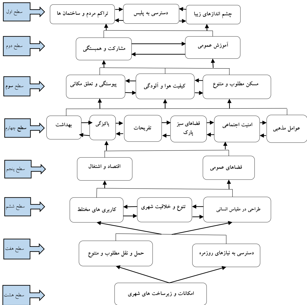
شکل ۲. مدل ساختاری-تفسیری زیست‌پذیری کلانشهر مشهد

بر اساس نتایج جدول (۵)، عوامل پیشران و موثر بر زیست‌پذیری کلان‌شهر مشهد، به هشت سطح طبقه‌بندی شده است. در شکل زیر روابط متقابل و تاثیرگذاری بین معیارها و ارتباط معیارهای سطوح مختلف نمایان است که موجب درک بهتر فضای تصمیم‌گیری می‌شود. دیاگرام نهایی بر اساس سطوح به دست آمده در گام قبلی و طبق ماتریس دستیابی نهایی ترسیم می‌شود. با توجه به سطوح هر یک از معیارها و