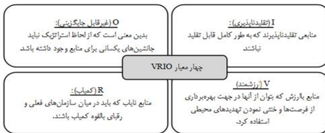
شکل ۱. معیارهای ایجاد یک استراتژی موفق از دیدگاه مبتنی بر منابع (VRIO)

اسناد فرادست (AFC) و منطبق با سند چشم انداز ۱۴۰۴ مشخص شد. ابتدا در این مرحله باید اهداف سازمانی را برشمرد و سپس این اهداف را الویت بندی کرد. الویت بندی در سه سطح الویت بالا، متوسط، پایین توسط گروه خبره و به روش دلفی صورت گرفته است. جدول ۱ بیانگر اهداف سازمانی و درجه اهمیت آن ها است. پس تدوین این جدول و درجه اولویت هر یک، اطلاعات وارد نرم افزار شد.