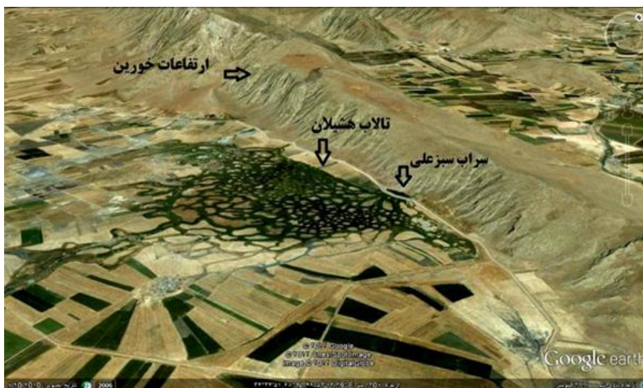
شکل ۱. موقعیت جغرافیای تالاب هشیلان (Google Earth)

سرایمن می و شله و نیز نزولات جوی تأمین می‌گردد. لازم به ذکر است در مواقع کم‌آبی که تالاب مورد تهدید قرار می‌گیرد، آب مورد نیاز از طریق کانال انتقال آب سد گاوشان تأمین می‌گردد. همچنین وجود لایه تورب و تنوع زیستی بالای گیاهان، خزندگان، آبزیان، پستانداران و بیش از ۲۰ گونه از پرندگان دائم و مهاجر و نیز فواید منظرهای و تفریحی در این تالاب باعث تمایز آن در میان تالاب‌های مختلف گردیده است. تالاب مذکور محدوده وسیعی در حدفاصل روستاهای هشیلان در ضلع جنوب شرقی تالاب، سراب شله در شمال غربی تالاب،